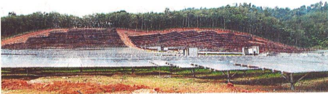
方氏集团投资1亿8000万令吉设29兆瓦的光伏电站。

(双溪大年14日讯) 方氏集团通过子公司立达光伏能源有限公司 (Leader Solar Energy Sdn Bhd-简称LSE)，投资1亿8000万令吉发展太阳能光伏发电事业。